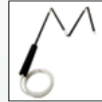
Разборный датчик отбора проб

Для получения полного списка принадлежностей обращайтесь в компанию BW Technologies.