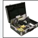
Комплект для работ в закрытых зонах