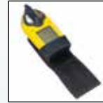
Чехол для крепления на ремне