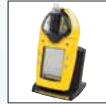
Встроенный насос и зарядное устройство батарей