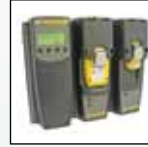
Compatibilité Micro-Dock II