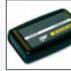
IR DataLink II

Pour obtenir la liste complète des accessoires, contactez BW Technologies.