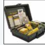
Pompe motorisée SamplerPak