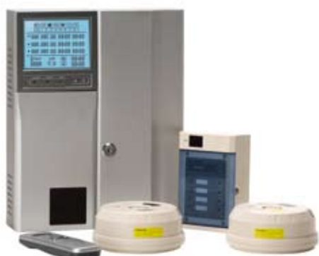
Système de détection de gaz adressable Metro

Les systèmes de détection de gaz d'Honeywell Analytics sont conçus pour déclencher des sorties d'alarme conformes aux limites d'exposition publiées.